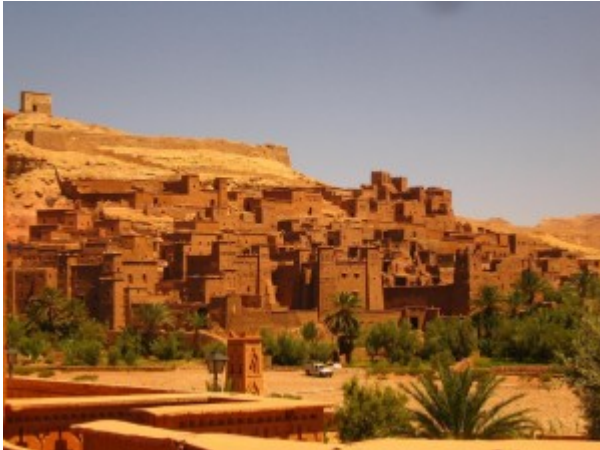
MAROC- MARELE TUR