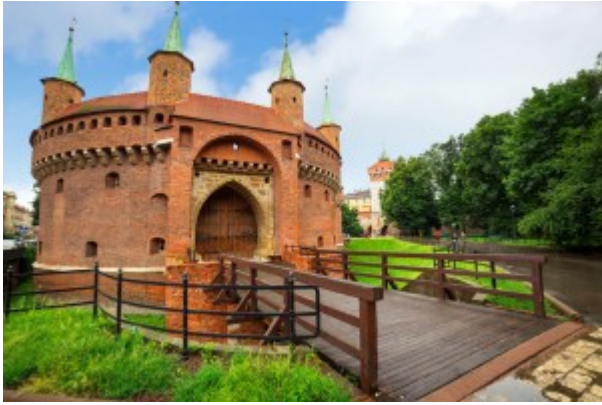
BUDAPESTA – CRACOVIA

Ziua 1 Dimineata devreme pornim din Lugoj , Timisoara si Arad spre Cracovia . Vom face un tur de oras panoramic in Budapesta: Citadela, Bastionul Pescarilor, Podurile peste Dunare, Insula Margareta, Catedrala Sf Stefan, Piata Eroilor, etc . Apoi stabatem Muntii Tatra cu peisajele lor frumoase. Sosire in capitala regiunii Malopolska .Cazare.